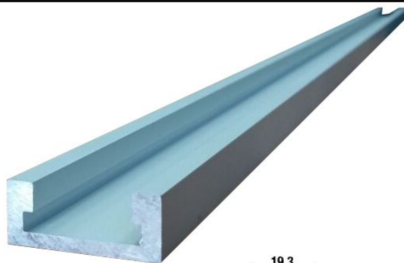
Профиль-шина 30,4 мм., анод., серебро матовое, 1 м.

Благодарим Вас за интерес, проявленный к оборудованию, предлагаемому группой компаний СТАНКО групп. Настоящим предлагаем Вашему вниманию технико-коммерческое предложение на поставку следующего оборудования, компании JPW Tools AG (Швейцария), страна происхождения (Тайвань, Китай)